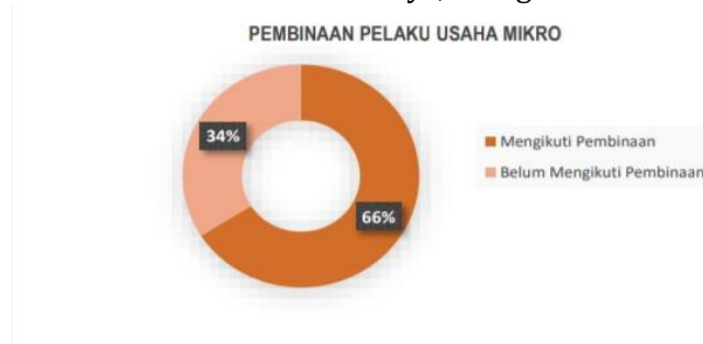
Gambar 3. Pembinaan bagi Pelaku Usaha Mikro

usahanya serta dapat pulih dari dampak pandemi Covid-19. Terdapat Persentase pembinaan bagi pelaku usaha mikro di Kecamatan Bulak Surabaya, sebagai berikut: